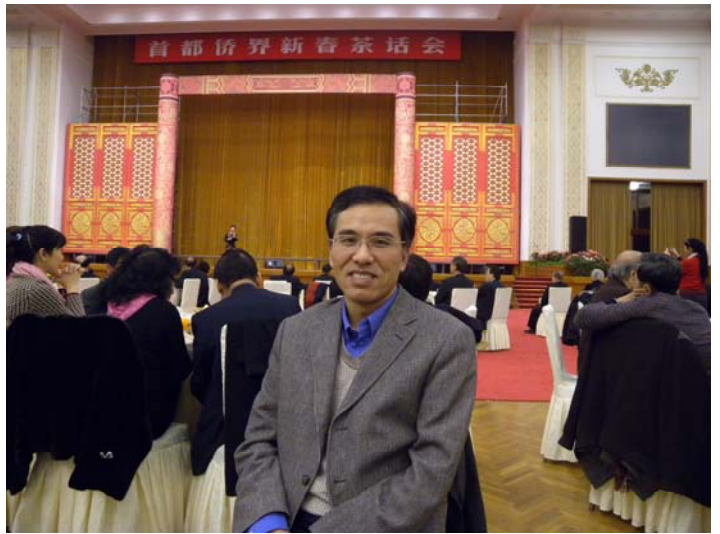
王总应邀参加首都侨界新春茶话会