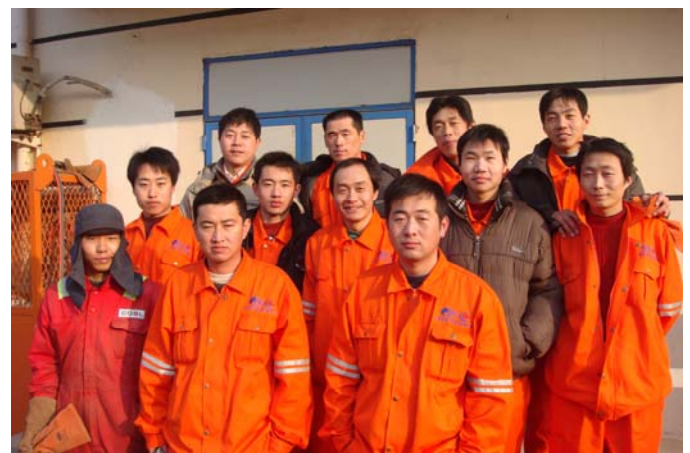
即将奔赴安哥拉Subsea7 的MODEC建造现场的焊工