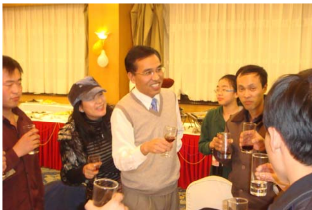
王总、赵总在宴会上