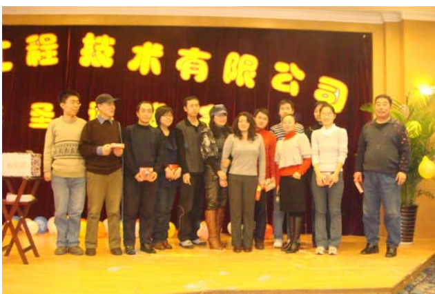
POE一等奖、二等奖合影