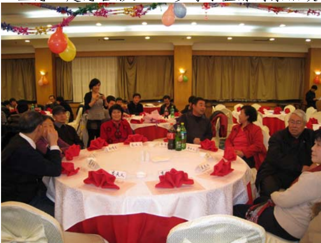
左起：聂工、赵工、郑工、宋工携夫人参加晚会