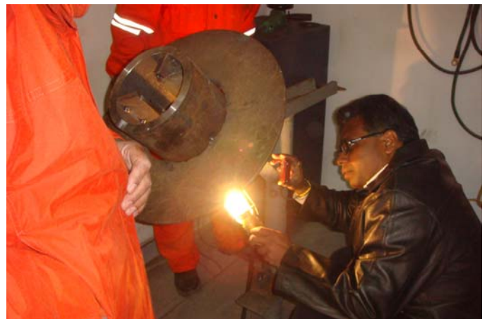
MODEC的Jagan对POE焊工的焊接试件进行目测

ABS、MODEC、Subsea 7和海工检验公司人员进行焊考前点名。POE承接了安哥拉BP项目的部分焊接工作。